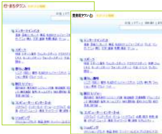
e-まちタウンディレクトリ http://dir.emachi.co.jp/ 豊島区タウンディレクトリ http://dir.toshimaku-town.com/

日本最大級の地域情報ポータルサイト『e-まちタウン』と315の地域にセグメントされたタウンサイトの計316のディレクトリに半永久的に掲載されます。